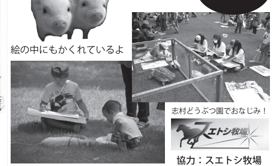
絵の中にもかくれているよ