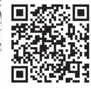
メール申込二次元バーコード