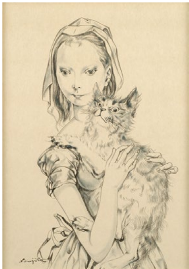
© Fondation Foujita/ ADAGP, Paris & JASPAR, Tokyo, 2019 C2854 ⑤

猫は今、その仕草の愛くるしさから大人気ですが、日本では弥生時代から人間と共存していたことが最近の研究であきらかになりました。穀物をたべてしまうネズミを退治する動物として大切にされてきたのです。