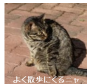
よく散歩にくるニャ 通称「チビ」 会えたらラッキー!